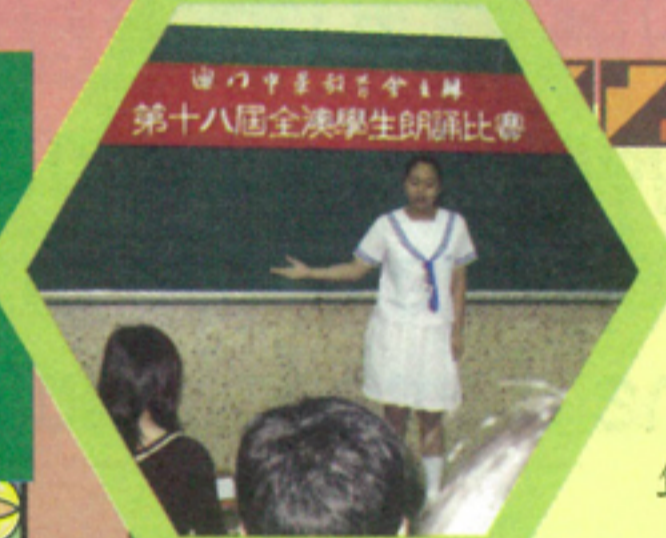
第十八屆全澳學生朗誦比賽

Em primeiro lugar está o mandarim com 874 milhões seguido do hindi, castelhano, inglês e bengali.