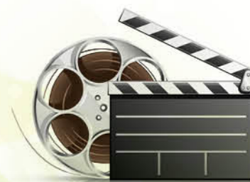
社會工作局禁毒影片——“真相”