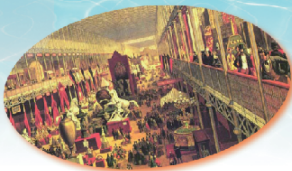
1851年國際博覽會在倫敦水晶宮舉行