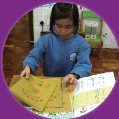
圖5 請學生把數學科的書簿一本一本疊好