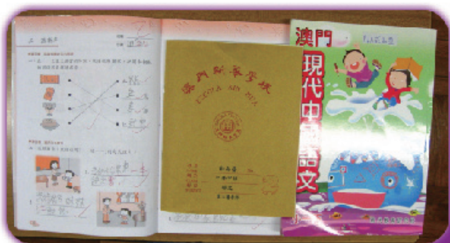
圖3 語文科還有生字簿、抄書簿， 請學生檢查好，都齊全了！

然後，請同學認識數學科的書簿， 由於數學科的書、補充習作、簿會比 較多，要很有耐心地教學生一一取出， 還要經常教和檢查做得好不好。