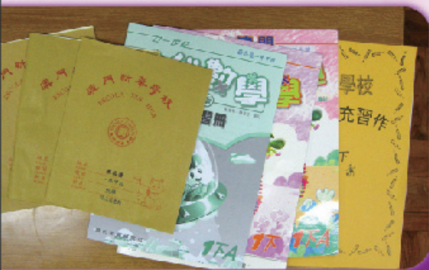
圖4 請學生把數學科所有的書簿一一取出， 還要數一數，家課簿有多少本、習作有 多少本……讓學生不會漏掉一本。

然後，請同學認識數學科的書簿， 由於數學科的書、補充習作、簿會比 較多，要很有耐心地教學生一一取出， 還要經常教和檢查做得好不好。