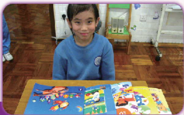
圖10 所有科目的書簿都分科疊好， 一疊一疊的不可以混亂，這樣 便可以放進書包裹。