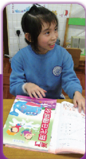
圖2 語文科，指導學生認識語文書、 語文習作簿一一取出，但不夠的……