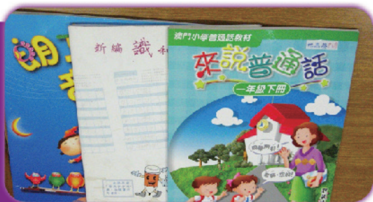
圖9 音樂科和普通話科的書簿也疊好了