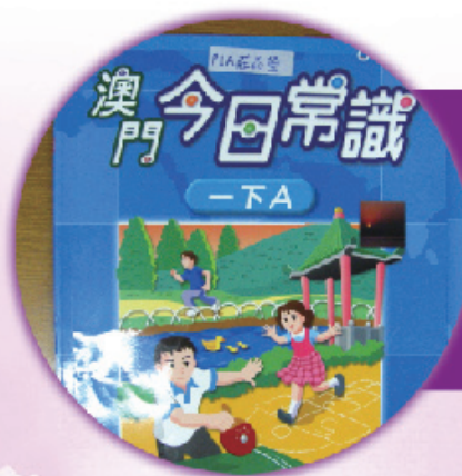
圖8 常識科的書簿也疊好了