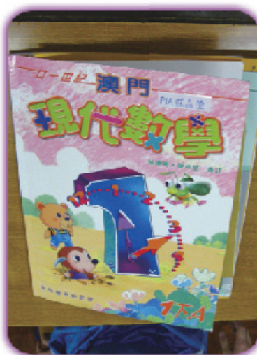
圖6 數學科的書簿便疊好了