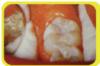
圖6. 牙溝封閉後，牙溝表面形成一層白色的保護膜

家長可以為小朋友選購一支不大於一個兩毫子硬幣直徑的牙刷頭，讓他們自行學習清潔牙齒，並要培養他們早晚刷牙的習慣。由於兒童的手腕未夠力，刷牙技巧仍未完全掌握，為了確保幼兒的牙齒刷得乾淨，父母要早晚替孩子補刷牙齒，並用牙線清理牙縫污垢。父母亦要從旁指導幼兒刷牙的姿勢。