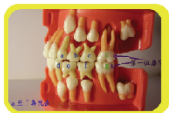
圖4. 混合換牙期的牙齒排列狀況