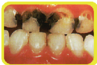
圖1. “奶瓶齲齒”的小孩長大後門牙蛀壞情況

除了上述某些父母對幼兒牙齒或口腔衛生護理疏忽之外，大多數市民還有一個錯誤的觀念：幼兒長出來的乳齒遲早都會脫落，所以即使有蛀牙也毋須理會。不單如此，他們平時也不注重兒童的牙齒衛生護理，令兒童的牙患愈加嚴重，對兒童的身心成長都構成很多負面的影響。